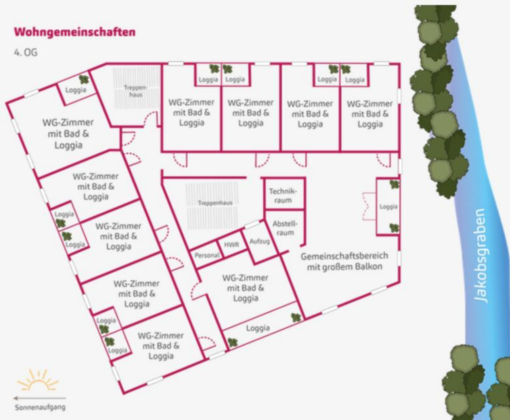
Beispiel-Grundriss einer Pflege-WG mit großzügigem Gemeinschaftsbereich

Gleichzeitig sind unsere Bewohnerinnen und Bewohner Teil eines lebendigen Quartiers, in dem sich Generationen begegnen. In der untersten Etage schaffen eine großzügige Tagespflege und ein öffentliches Quartierscafé Orte der Begegnung, des Austauschs und der Nähe. So verbinden wir Geborgenheit mit Offenheit – und Pflege mit einem Zuhause, in dem man sich wohlfühlen kann.